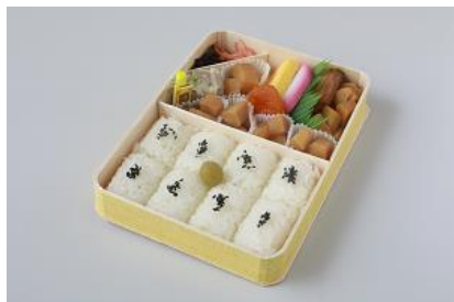
シウマイ4個と鶏唐揚げを筍煮にチェンジ!

①超シウマイ弁当(シウマイと唐揚げが筍煮に) ②細かすぎて伝わらない超シウマイ弁当