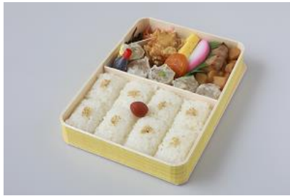
小梅(青梅→赤梅)とゴマ(黒ゴマ→白ゴマ)、しょう油入れ→お魚しょう油入れ