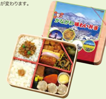
冬のかながわ味わい弁当