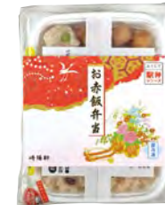
おうちで駅弁シリーズ お赤飯弁当 670円(税込)