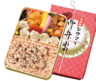
お赤飯シウマイ弁当