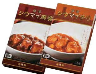
横濱シウマイ麻婆 横濱シウマイチリ 1人前 各 420円(税込)