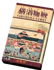
横濱かりい 1人前 440円(税込)