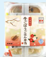
おうちで駅弁シリーズ 冬季限定 牛ごぼうごはん弁当 730円(税込)