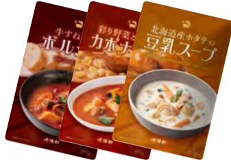
牛すね肉のボルシチ 彩り野菜と鶏肉のカボナータ風 北海道産ホタテの豆乳スープ 300g 各 730円(税込)