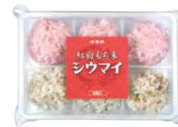
紅白もち米シウマイ 6個入 520円(税込)