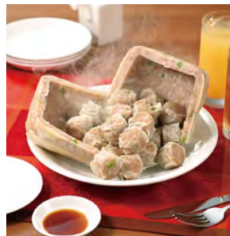
おうちでジャンボシウマイ mini 3,700円(税込) ※ご予約限定 ※店舗でのお渡しは冷蔵