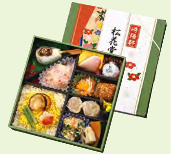
松花堂弁当 ~帆立ごはん~