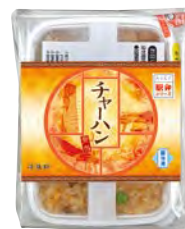
おうちで駅弁シリーズ チャーハン弁当 670円(税込)