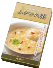
ふかひれ粥 1人前 390円(税込)