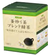
崎陽軒 釜炒り茶ブレンド緑茶 2g×10袋(ティーバッグ) 750円(税込)