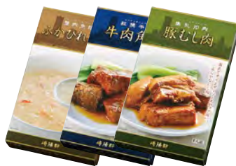
ふかひれスープ 牛肉角煮 豚むし肉 1人前 各 740円(税込)