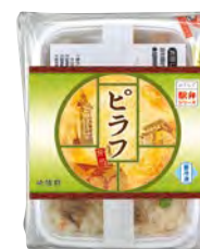
おうちで駅弁シリーズ ピラフ弁当 670円(税込)