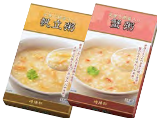
帆立粥 蟹粥 1人前 各 330円(税込)