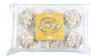
もち米シウマイ 6個入 520円(税込)