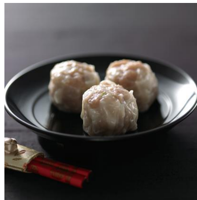
「特製シウマイ」イメージ