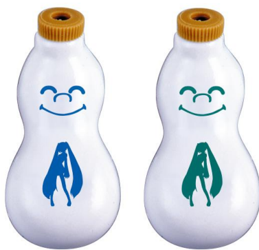
「初音ミクコラボひょうちゃん(全2色)」 2色のうち、どちらか1色が入っています。