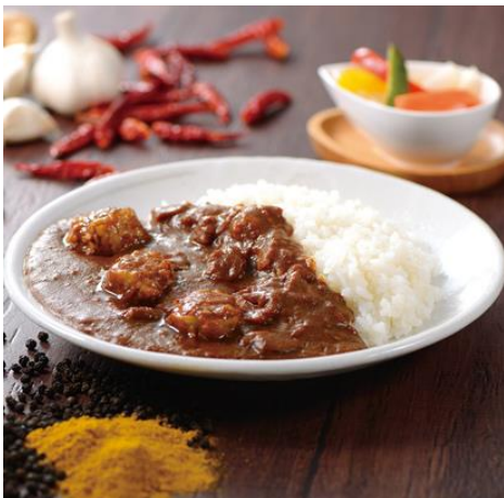
「横濱かりい」イメージ