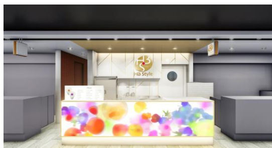
店舗外観イメージ