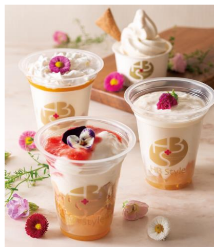
メニューイメージ