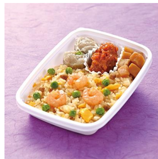
「美空ひばりさん三十三回忌 おうちで駅弁シリーズ チャーハン弁当」