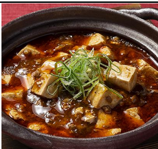
痺れる四川風麻婆豆腐