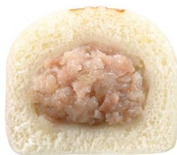
「シウマイまん」断面