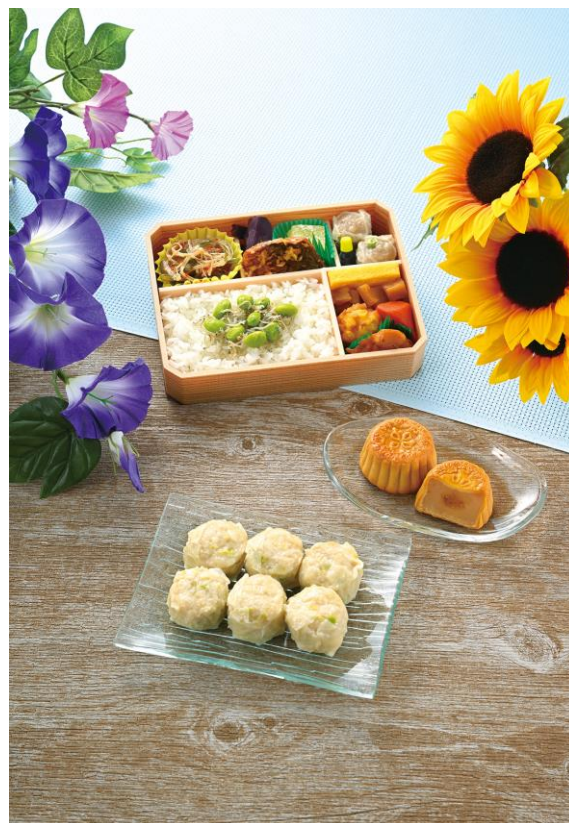
上から「おべんとう夏」「横濱月餅 オレンジ」「いかシウマイ」