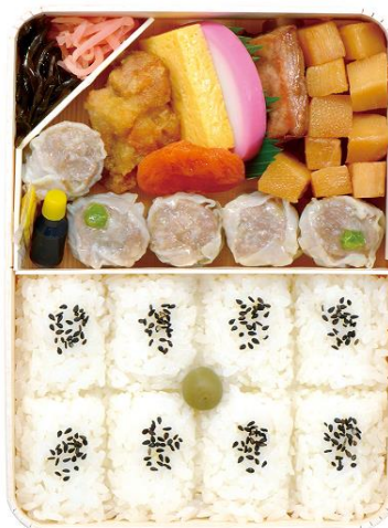
(「シウマイ弁当」中身)