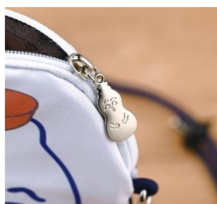
ひょうちゃん型チャーム