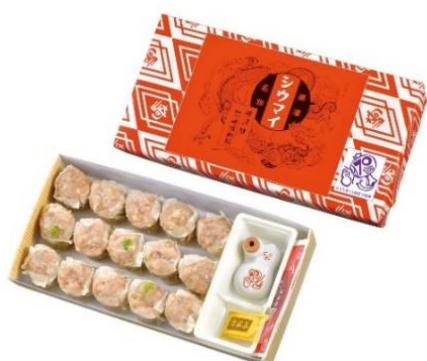
↑ 70周年記念ひょうちゃん入り昔ながらのシウマイ