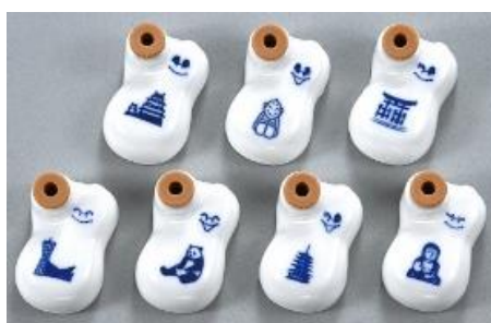
関西限定ひょうちゃん (全7種)

■ お客様向けお問い合わせ先 株式会社 崎陽軒 お客様相談室 フリーコール:0120-882-380