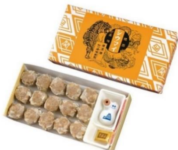
関西シウマイ 15 個入